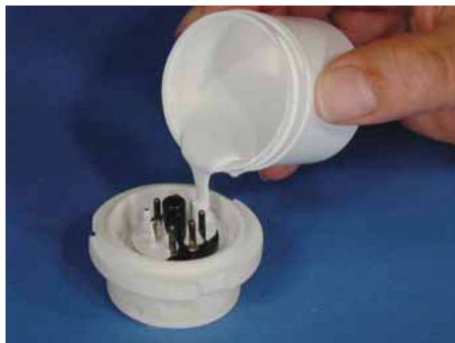
電子部品の高絶縁封止